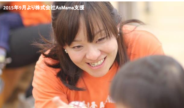
2015年9月より株式会社AsMama支援