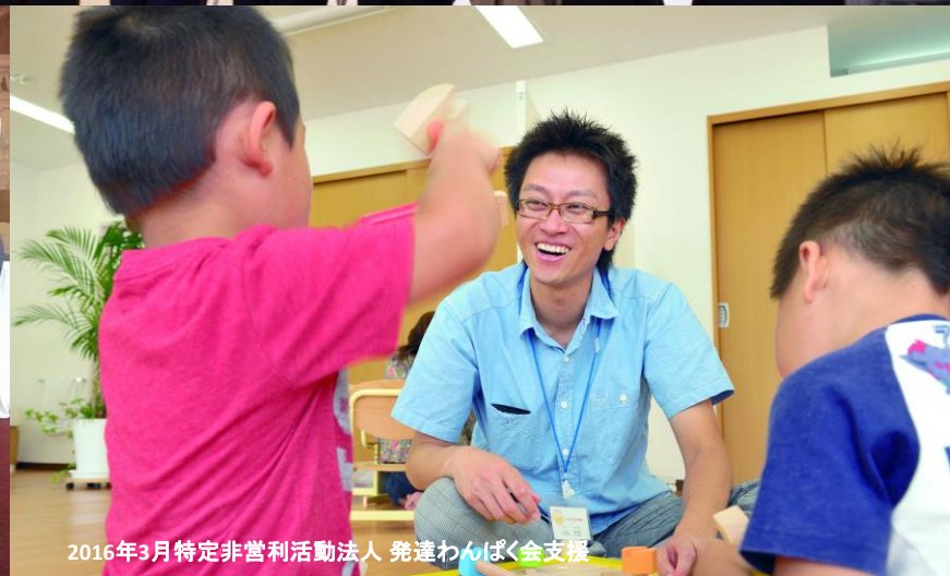
2016年3月特定非営利活動法人 発達わんぱく会支援

Jvopf Japan Venture Philanthropy Fund 日本ベンチャーフィランソロピー基金