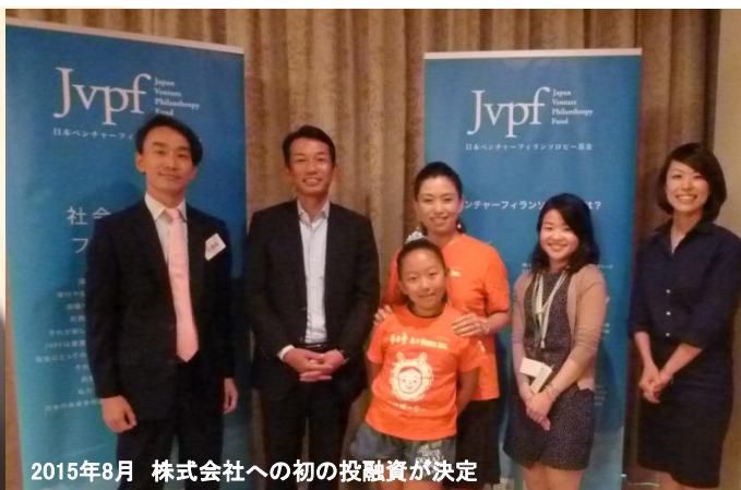
2015年8月 株式会社への初の投融資が決定