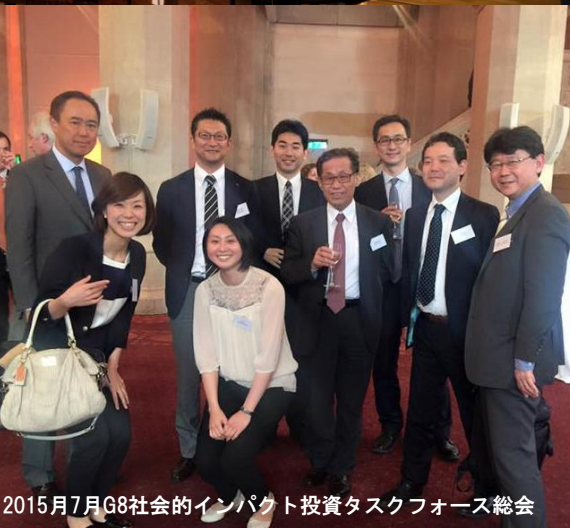
2015年7月G8社会的インパクト投資タスクフォース総会