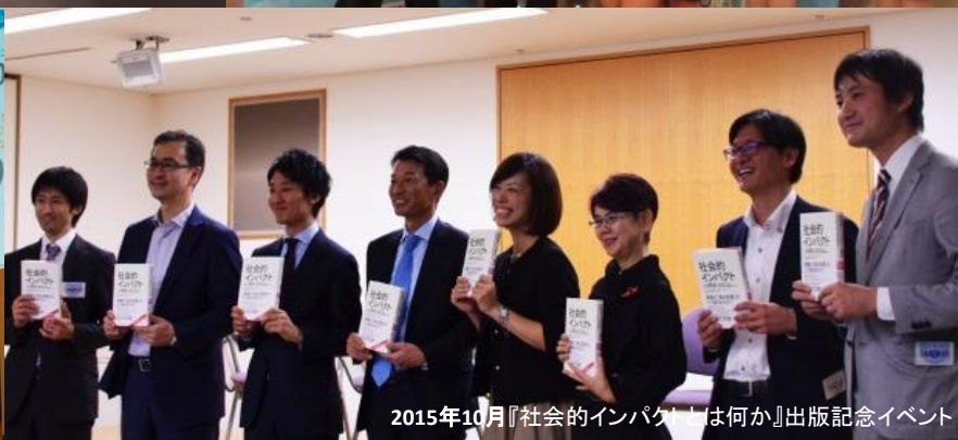
2015年10月『社会的インパクトとは何か』出版記念イベント