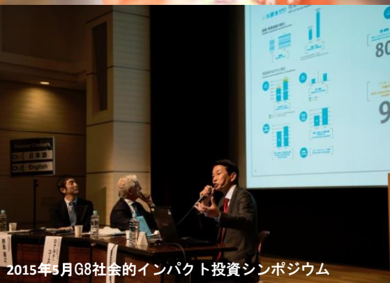
2015年5月G8社会的インパクト投資シンポジウム